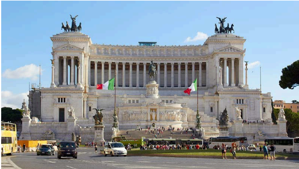
Il Vittoriano – in piazza Venezia – Roma