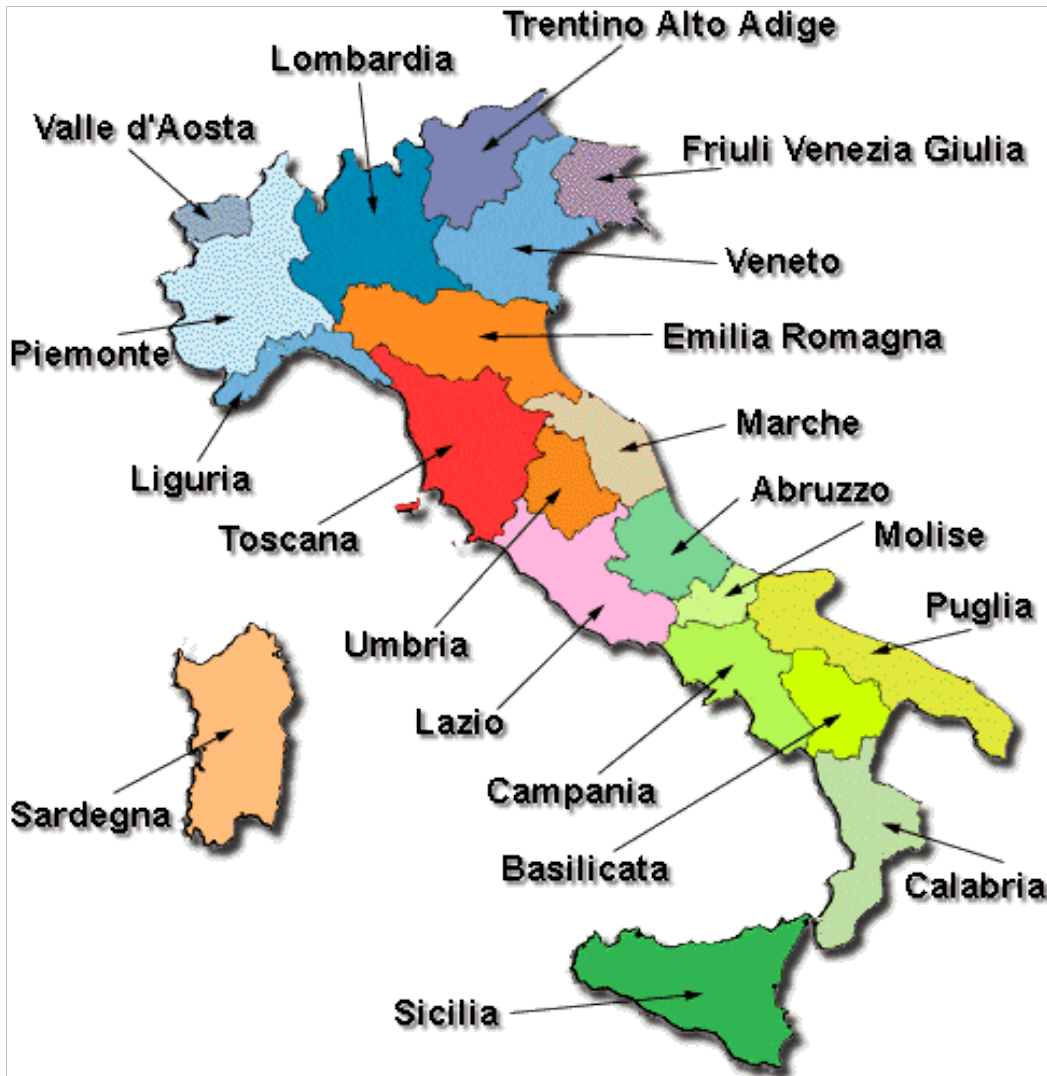
Italia suddivisa per regioni