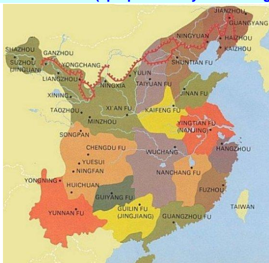
Carte de Chine (époque actuelle)