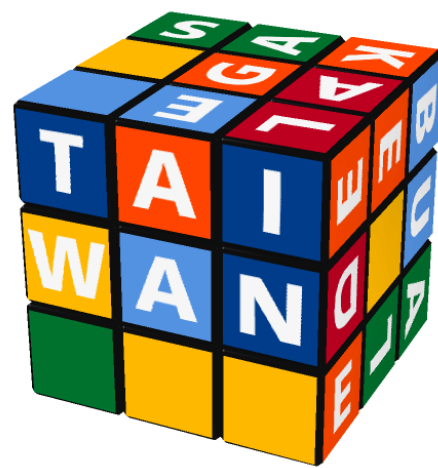
台湾 Táiwān (Taiwan)