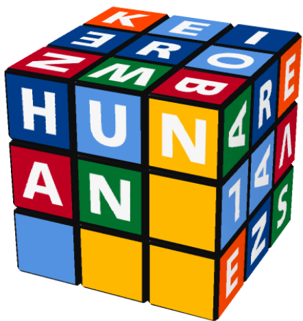
湖南 Húnán (Hunan)