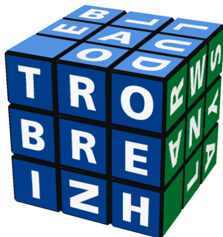
Tro-Breizh (tour de Bretagne)

http://www.randelshofer.ch/rubik/virtual_cubes/rubik/picture_cubes/breton_first_names_cube.html