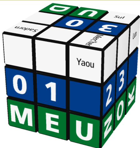
Jeudi 1 er Mars (2018)

http://www.randelshofer.ch/rubik/virtual_cubes/rubik/calendar_cubes/calendar_cube_br.html