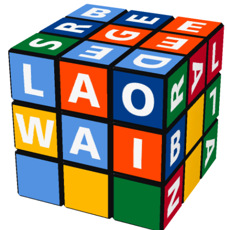
老外 Lǎowài (Étranger)