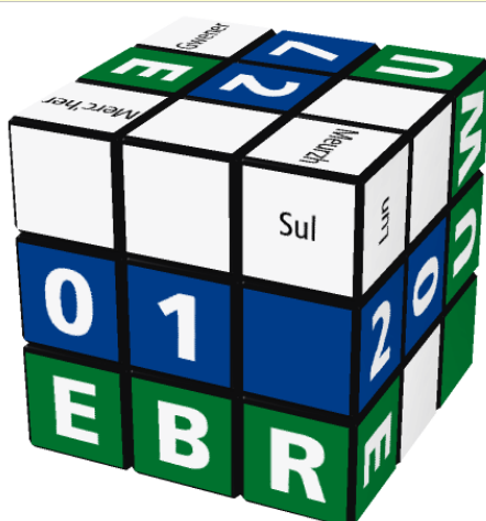
Dimanche 1 er Avril (2018)