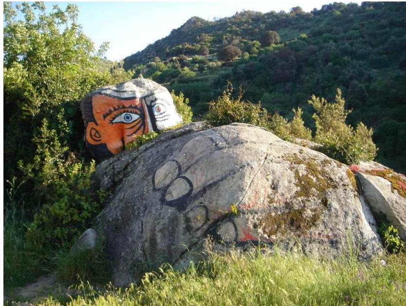
Vicino a Orgosolo