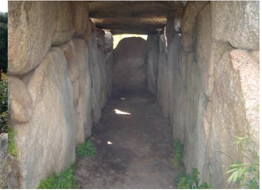
Tombe dei giganti: menhir