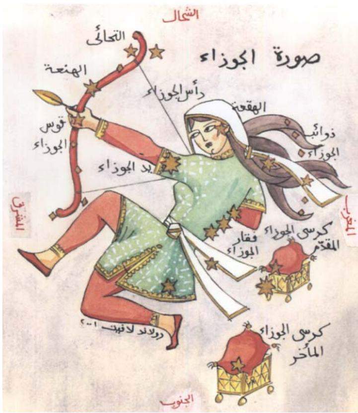
La constellation arabe d'al-Jawzâ'