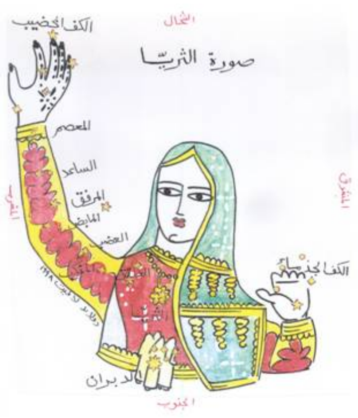
La constellation arabe d'al-Thurayyâ